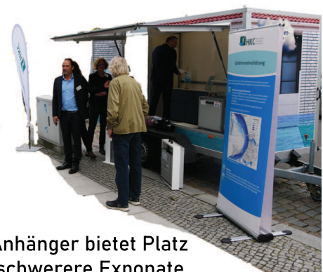
Der Anhänger bietet Platz für schwerere Exponate.