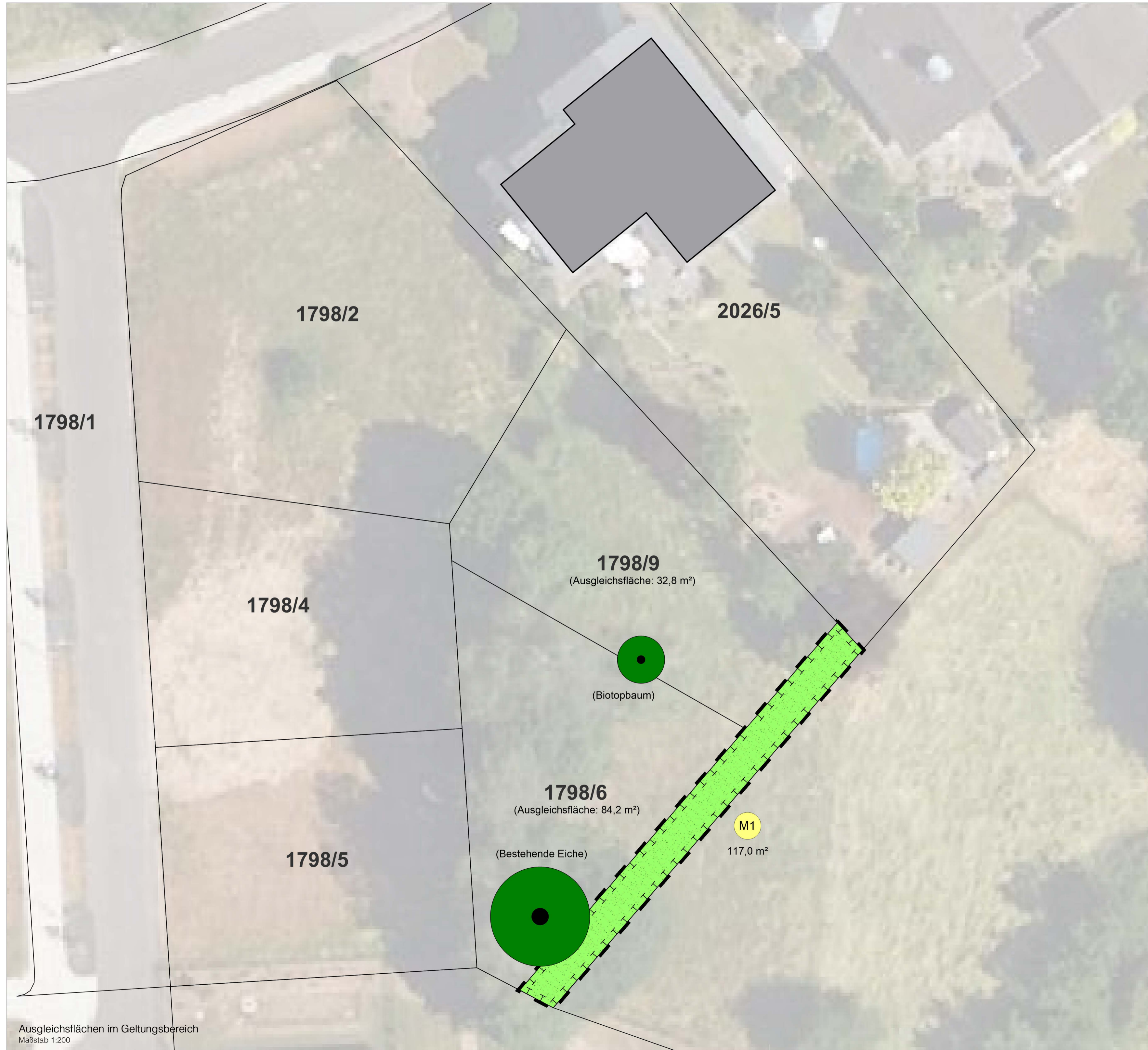
Ausgleichsflächen im Geltungsbereich Maßstab 1:200

Alle Daten beruhen auf dem UTM (Universal Transverse Mercator) Koordinatensystem.