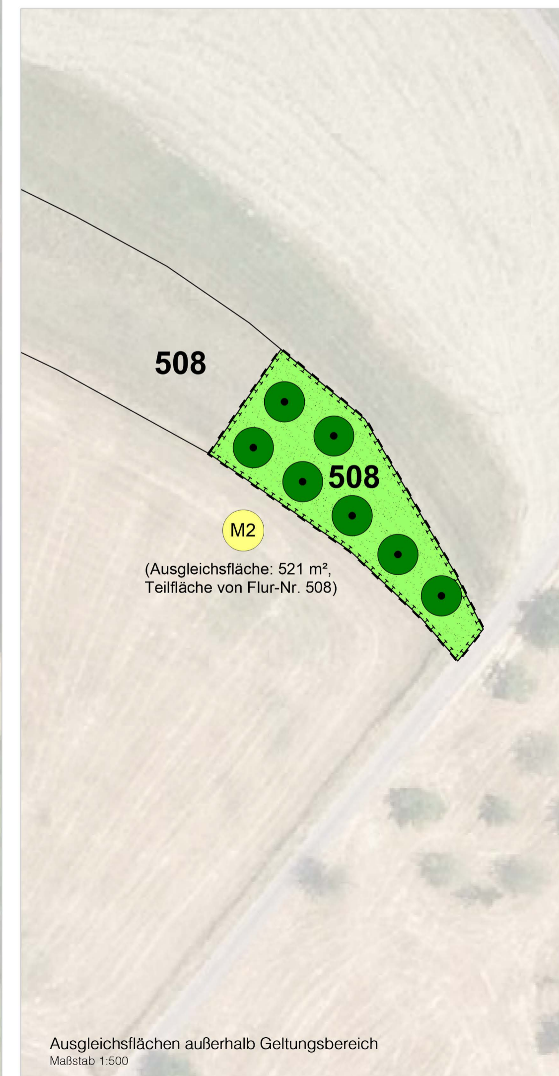
Ausgleichsflächen außerhalb Geltungsbereich Maßstab 1:500

Flurnummer 508, Gemarkung Roßbach (Leidersbach)